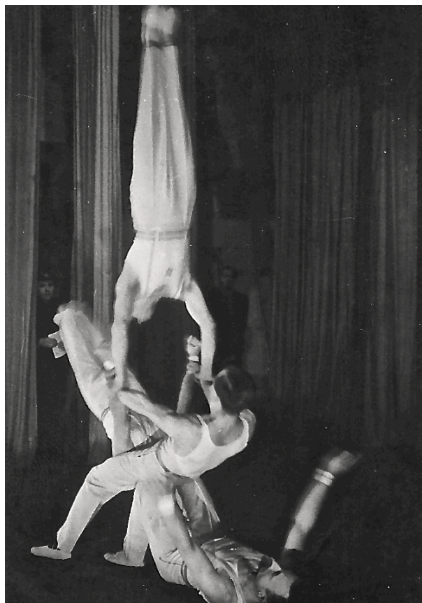
Afb.4 Kleine acrobatieoptredens moesten KTS bekendmaken bij het Hobokense publiek.

Een eerste turnfeest werd gehouden op zaterdag, 25 februari 1951 het eerste verjaringsfeest van de KTS. Het werd een gevuld dagprogramma: om 9 uur kwamen de turners bijeen in het Gildenhuis aan de Krugerstraat. Vervolgens werd de nieuwe vlag gewijd door de proost tijdens de H.Mis van 9:30 uur in de parochiekerk van het H.Hart. Daarna werd er een optocht gehouden op het Heiken . Om 19 uur begon dan het turnfeest in het Gildenhuis.